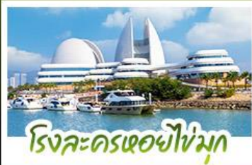
โรงละครเซอซิงมุก