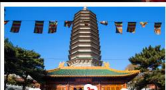
วัดพระเขี้ยวแก้ว