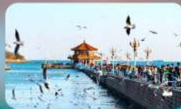
สะพานจันเฉียว