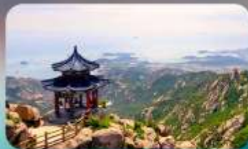
กูเจาหล่าซาน