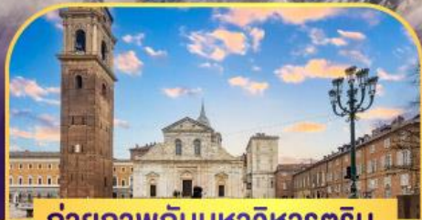
ถ่ายภาพกับมหาวิหารดูริน