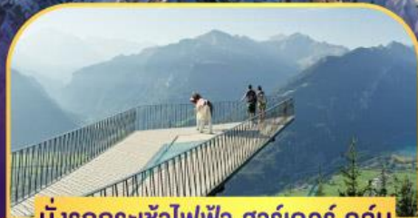
นั่งรถกระเช้าไฟฟ้า ชาร์เตอร์ ดูคัม