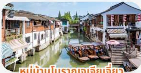
หมู่บ้านโบราณอูเจียเจียว