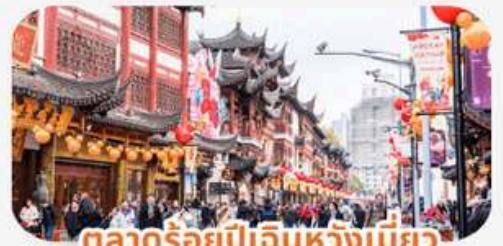
ตลาดร้อยปีเดินหวังเมี่ยว