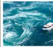
คลองเรือชมน้ำวนมารุโตะ

วัดบึงไชน / ตลาดกิงงะ / โบสถ์โกะทาวน์ (จุดชมวิว) / สะพานคินไตเคียว เกาะมียาจิมา ศาลเจ้าอิตสึคุชิมะ / สวนอนุสรณ์สันติภาพฮิโรชิมา โดโกะออนเซ็น / ถนนโอโมเตะซันโด คมปีระซัง / ปราสาทนัตสึยามา กิจกรรมทำเส้นอุด้ง / สวนริทสึริน / สถานีรับทางคุรุคุรุมารุโตะ คลองเรือชมน้ำวนมารุโตะ / ซุปป์งย่านชินโซบาช / ตลาดปลาคุโรมง / ซุปป์งย่านอุมาเดะ