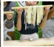
กิจกรรมทำเส้นอุด้ง