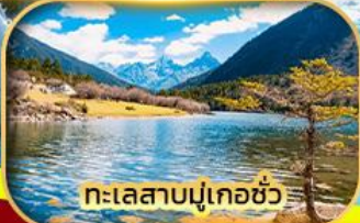
ทะเลสาบมู่เกอซัว