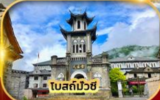
โบสถ์บ๊วย