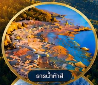
ธารน้ำห้ำสี่