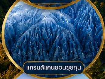
แกรนด์แคนยอนซุยกุณ