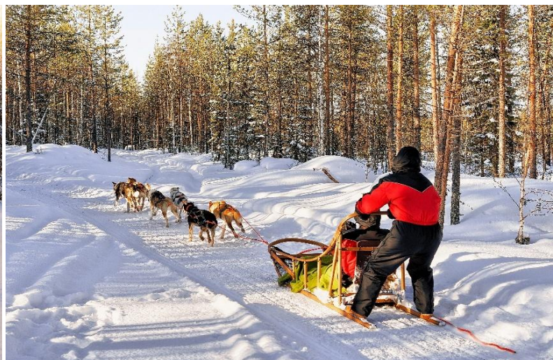
DOG SLEDDING ADVENTURE