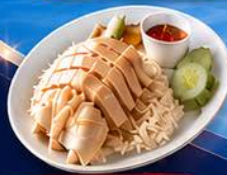
ข้าวมันไก่ปีนัง