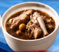
มะกูดเต้