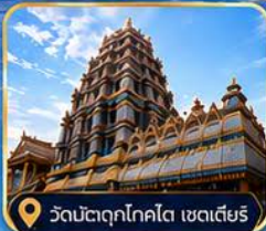
วัดมัตตุกโคตโต เซดเตียร์