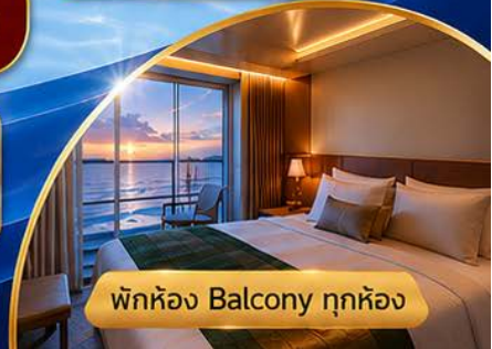
ห้องพัก Balcony ทุกห้อง