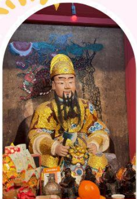
วัดเซกกองเก่าแก่ 600 ปี หยุนหลง

"ไหว้พระ เสริมดวง เพิ่มสิริมงคลแก่ชีวิต"