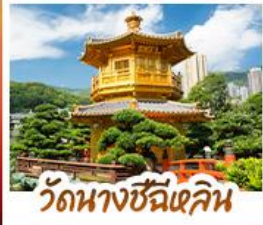
วัดนางชีฉีเสลิน