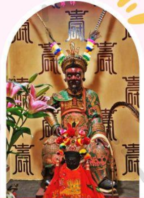
วัดเซกกองเก่าแก่ 400 ปี ไซกง