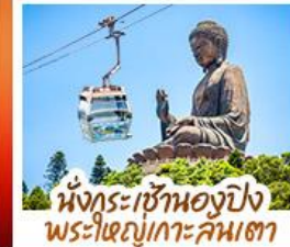
นั่งกระเช้าองปิง พระใหญ่เกาะคัมถา