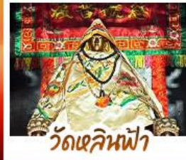
วัดเสลินฟ้า