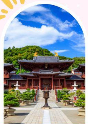
วัดนางชีฉีหลิน สวนหนานเหลียน