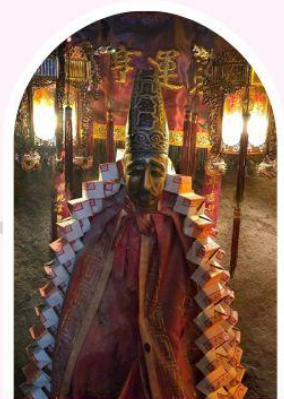
วัดหลินฟ้า โชคลากและความมั่งคั่ง