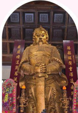
วัดเซก ซาถึน ขอพรโชคลาก การเงิน และธุรกิจ