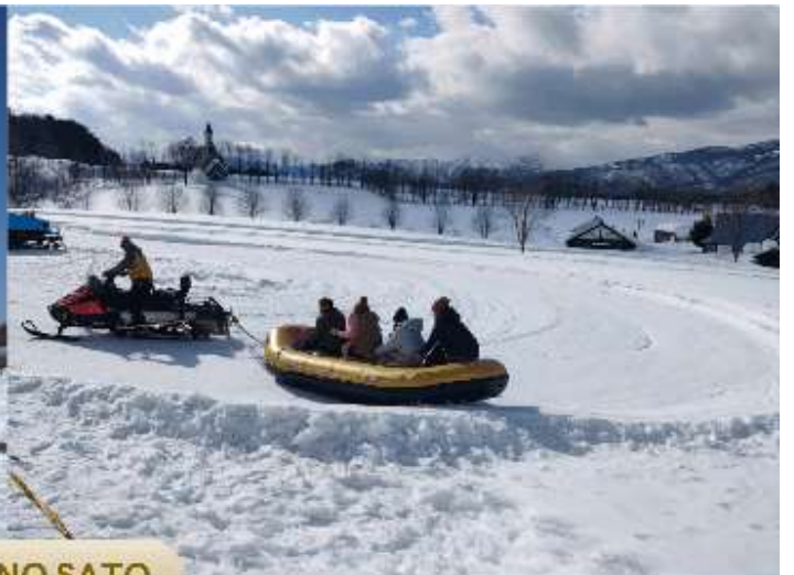
BOKKA NO SATO