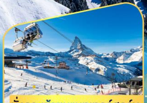
นั่งกระเช้าชมแมทเทอร์ฮอร์น