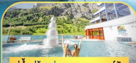
แช่น้ำแร่ร้อนผ่อนคลายลวยคอร์บิค