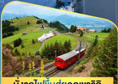
นั่งรถไฟขึ้นสู่ยอดเขาโรทิก