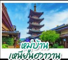
หมู่บ้านเหมียนฮวาวาน