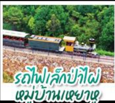
รถไฟลึกลับบ้านเหมียนฮวาวาน