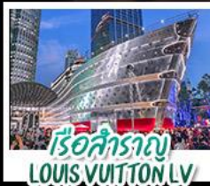
เรือสำราญ LOUIS VUITTON LV