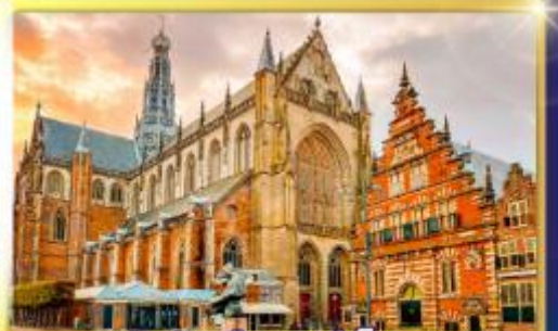
จัตุรัสเมืองฮาร์ลิม

ชมแคนเมืองแปลกเนเธอร์แลนด์และเบลเยียม เดินเมืองเคลฟท์ เมืองเครื่องปั้นดินเผาระดับโลก ฮาร์ลิมเมืองมั่งคั่งที่สุดของเนเธอร์แลนด์