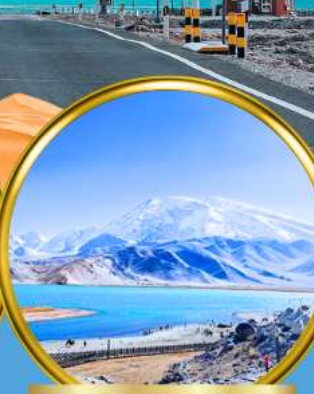
Kala Kule Lake