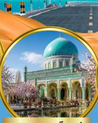
สุสานสมหอมเซียนเฟย