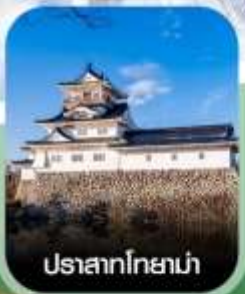
ปราสาทโทยาม่า