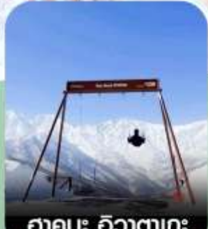
ฮาคุบะ อิวาตาเกะ