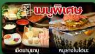
เอ็งตามาฮานู