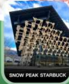
SNOW PEAK STARBUCK