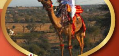
ฟรี ทัชมาฮาล เมืองมันทาวา ราคาเริ่มต้น