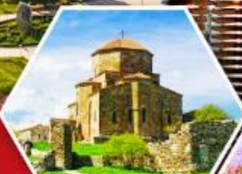
วิหารกอรี