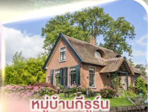
หมู่บ้านกีร์รูน