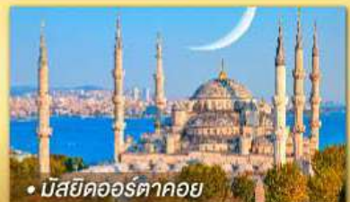
• มัสยิดออร์ตาคอย