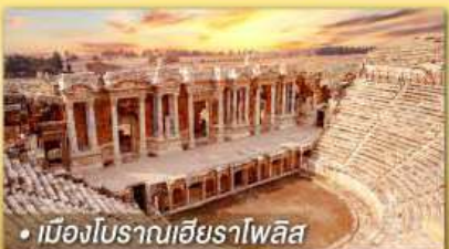
• เมืองโบราณเฮียราโพลิส