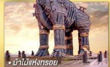
• บ้านไม้แห่งทรอย