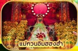
แม่กวนอิมของฮำ