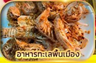
อาหารทะเลพื้นเมือง