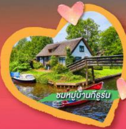
ชมหมู่บ้านกังหัน