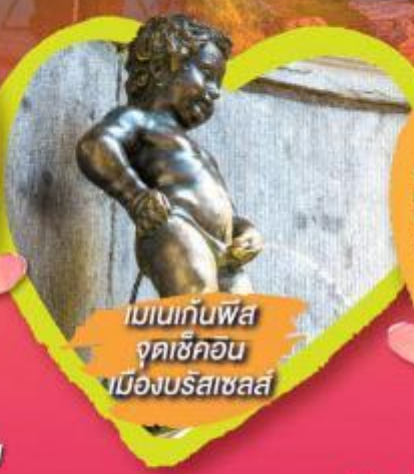
เบเนกั๊งฟัส จุดชั๊กคอน เมืองบรัสเซลส์