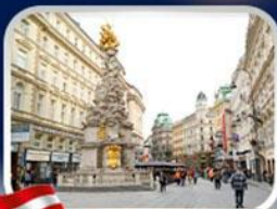
ซ็อบปีงการ์ทเนอร์สตรีท