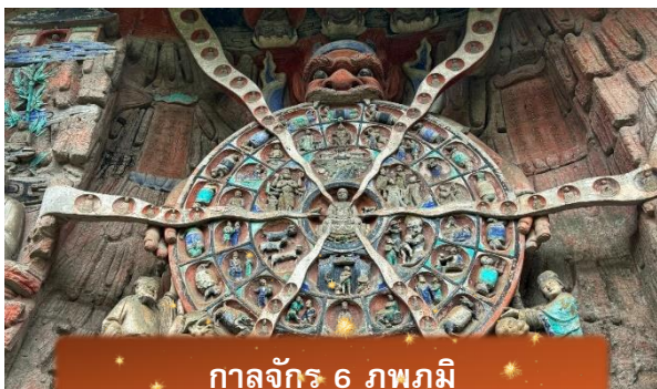
กาลจักร 6 ภพภูมิ

หลังจากนั้นนำท่านเดินทางกลับ เมืองฉงชิ่ง